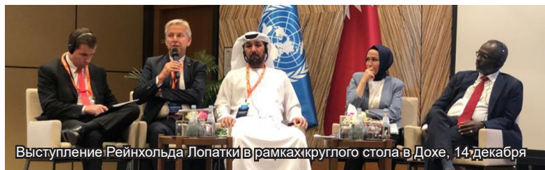
Выступление Рейнхольда Лопатки в рамках круглого стола в Дохе, 14 декабря

Председатель КПТ подчеркнул необходимость объединения усилий парламентских ассамблей и повышения их эффективности. Он призвал