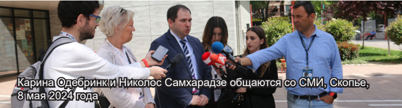
Карина Одебринк и Николос Самхарадзе общаются со СМИ, Скопье, 8 мая 2024 года

В опубликованном в Скопье 9 мая заявлении международные наблюдатели отметили, что второй тур президентских выборов и парламентские выборы в Северной Македонии были конкурентными, обширная и плюралистическая кампания позволила избирателям сделать информированный выбор, однако процесс сопровождался негативной риторикой, националистическими заявлениями, недостатками в законодательстве, а также