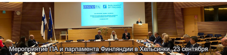
Мероприятие ПА и парламента Финляндии в Хельсинки, 23 сентября

23 сентября в рамках инициативы «Хельсинки +50 – «Призывы к действию» состоялся семинар, направленный на рассмотрение путей укрепления ОБСЕ с тем, чтобы организация продолжала выступать в качестве уникального механизма наведения мостов во всем регионе ОБСЕ. В качестве высшего приоритета организации было обозначено установление мира в Украине. В мероприятии, организованном совместно парламентом Финляндии и ПА ОБСЕ, приняли участие ряд членов Бюро ПА ОБСЕ, включая заместителей Председателя и должностных лиц Общих комитетов, а также специальных представителей.