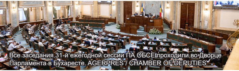
Все заседания 31-й ежегодной сессии ПА ОБСЕ проходили во Дворце Парламента в Бухаресте.