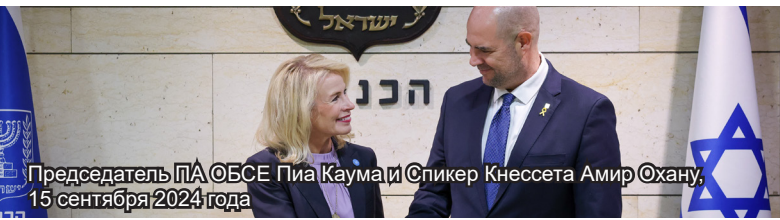
Председатель ПА ОБСЕ Пиа Каума и Спикер Кнессета Амир Охану, 15 сентября 2024 года