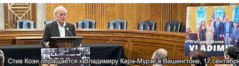
Стив Козн обращается к Владимиру Кара-Мурзе в Вашингтоне, 17 сентября

На мероприятии Комитета Сената по международным отношениям в Вашингтоне во вторник Специальный представитель ПА ОБСЕ по политическим заключенным Стив Козн (США) встретился с Владимиром Кара-Мурзой, журналистом, недавно освобожденным из российской тюрьмы. С.Козн отметил, что в качестве специального представителя он последовательно выступал за его освобождение и рад, что теперь он находится дома с семьей.