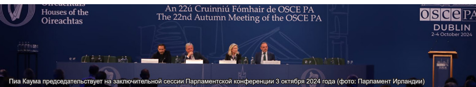
Пиа Каума председательствует на заключительной сессии Парламентской конференции 3 октября 2024 года

На прошлой неделе в Дублине, по приглашению Парламента Ирландии, около 200 парламентариев ОБСЕ собрались на Парламентскую конференцию на тему «Пятьдесят лет спустя Хельсинки: роль парламентов в укреплении всеобъемлющей модели мира и безопасности ОБСЕ».