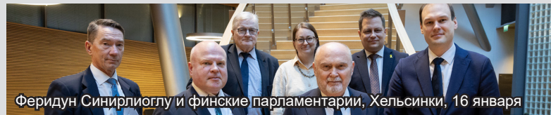
Феридун Синирлиоглу и финские парламентарии, Хельсинки, 16 января