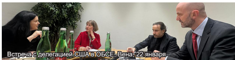
Встреча с делегацией США в ОБСЕ, Вена, 22 января