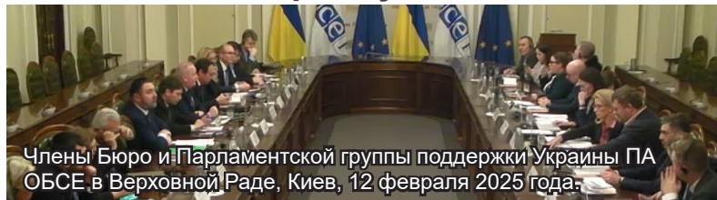
Члены Бюро и Парламентской группы поддержки Украины ПА ОБСЕ в Верховной Раде, Киев, 12 февраля 2025 года.