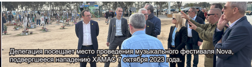
Делегация посещает место проведения музыкального фестиваля Nova, подвергнувшегося нападению ХАМАС 7 октября 2023 года.