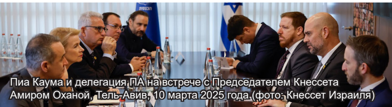
Пи́а Каума и делегация ПА на встрече с Председателем Кнессета Амиром Оханой, Тель-Авив, 10 марта 2025 года.