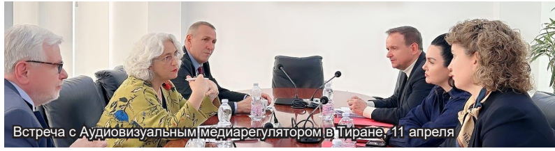
Встреча с Аудиовизуальным медиарегулятором в Тиране, 11 апреля