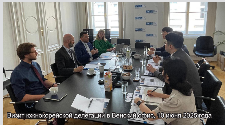
Визит южнокорейской делегации в Венский офис, 10 июня 2025 года