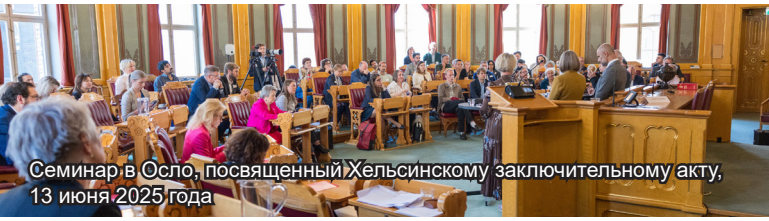
Семинар в Осло, посвященный Хельсинкскому заключительному акту, 13 июня 2025 года

Восстановление безопасности и сотрудничества в Европе, охваченной войной, стало основной темой семинара, который прошел 13 июня в норвежском Стортинге в Осло при поддержке делегации Норвегии в ПА ОБСЕ. На мероприятии, посвященном возрождению приверженности международным нормам в преддверии 50-й годовщины Хельсинкского заключительного акта, участники отметили сохраняющуюся актуальность документа и необходимость практического применения заложенных в нём принципов.