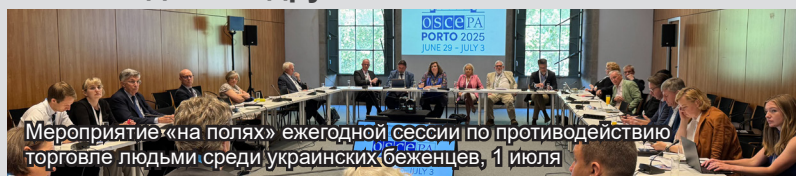
Мероприятие «на полях» ежегодной сессии по противодействию торговле людьми среди украинских беженцев, 1 июля

В понедельник в рамках ежегодного обеда по гендерным вопросам, организованного совместно Специальным представителем ПА ОБСЕ по гендерным вопросам Хеди Фрай (Канада) и главой делегации Португалии в ПА ОБСЕ Паулой Кардосо, рассматривалась тема сексуального и репродуктивного здоровья и прав. Мероприятие под названием «Демографическая зима», организованное Специальным представителем по демографическим изменениям и безопасности Гудрун Куглер