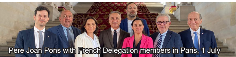
Pere Joan Pons with French Delegation members in Paris, 1 July

На полях Всемирного конгресса против смертной казни, проходящего на этой неделе в Париже, Председатель ПА ОБСЕ Пери Жоан Понс (Испания) провёл ряд встреч с международными и французскими партнёрами, сосредоточив внимание на правах человека, верховенстве права, безопасности и значении многостороннего сотрудничества.