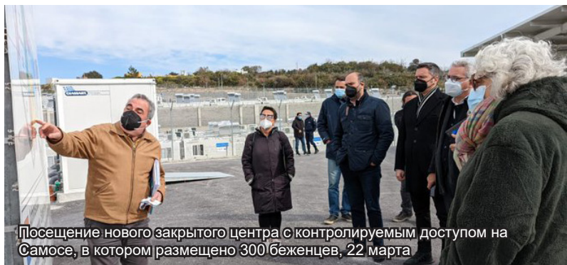
Посещение нового закрытого Центра с контролируемым доступом на Самосе, в котором размещено 300 беженцев, 22 марта

Делегация Парламентской ассамблеи ОБСЕ в составе ряда членов Специального комитета по миграции завершили сегодня трехдневный визит на Лесбос, Самос и в Афины. Цель визита заключалась в оценке достигнутого прогресса в области управления миграцией на островах Эгейского моря спустя семь лет после разгара миграционного кризиса.