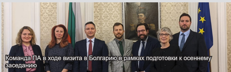
Команда ПА в ходе визита в Болгарию в рамках подготовки к осеннему заседанию

Представители ПА ОБСЕ, принимающей стороны, а также