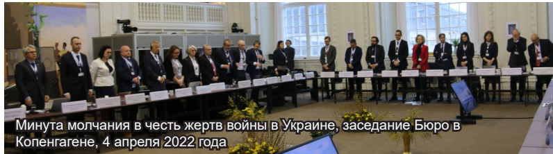
Минута молчания в честь жертв войны в Украине, заседание Бюро в Копенгагене, 4 апреля 2022 года

Генеральный секретарь ПА ОБСЕ Роберто Монтелла отметил, что Ассамблея последовательно и недвусмысленно выступает с осуждением происходящего в Украине, а также осуществляет активную деятельность на местах. Он акцентировал роль ОБСЕ