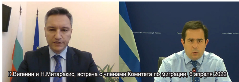
К.Вигенин и Н.Митаракис, встреча с членами Комитета по миграции, 6 апреля 2022

Члены Комитета задали вопросы, касающиеся предполагаемого выдворения мигрантов, задержках при составлении национальных