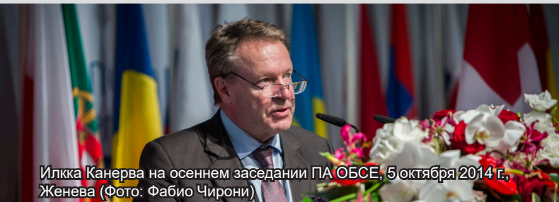
Иллка Канерва на осеннем заседании ПА ОБСЕ, 5 октября 2014 г., Женева

14 апреля ПА ОБСЕ с прискорбием узнала о кончине в возрасте 74 лет бывшего Председателя Ассамблеи Иллки Канервы, члена парламента Финляндии. Узнав эту новость, Председатель ПА ОБСЕ Маргарета Седерфельт и Генеральный секретарь Роберто Монтелла выразили соболезнования семье г-на Канервы и поблагодарили за его многолетнюю службу в Парламентской ассамблее.