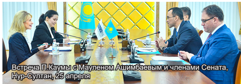
Встреча П.Каумы с Мауленом Ашимбаевым и членами Сената, Нур-Султан, 25 апреля

Во вторник завершился визит заместителя Председателя и Специального представителя ПА ОБСЕ по Центральной Азии П.Каумы (Финляндия) в Кыргызстан и Казахстан, в ходе которого обсуждались вызовы, с которыми сталкиваются две страны, пути оказания поддержки со стороны Ассамблеи, а также активизации участия парламентариев двух стран в работе ПА ОБСЕ.