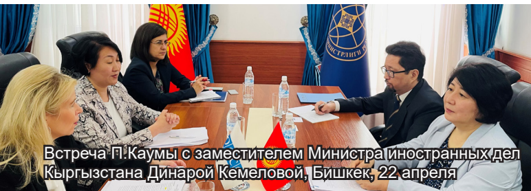
Встреча П.Каумы с заместителем Министра иностранных дел Кыргызстана Динарой Кемеловой, Бишкек, 22 апреля