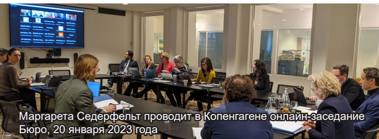
Маргарета Седерфельт проводит в Копенгагене онлайн-заседание Бюро, 20 января 2023 года

20 января состоялось онлайн-заседание Бюро ПА ОБСЕ, посвященное подготовке к 22-му зимнему заседанию, которое пройдет в следующем месяце в Вене, а также рассмотрению вопросов участия, которые возникли у ряда национальных делегаций. Председатель Маргарета Седерфельт (Швеция) приняла участие в онлайн-встрече из Международного секретариата в Копенгагене, в то время как остальные участники присоединились с помощью платформы Zoom.