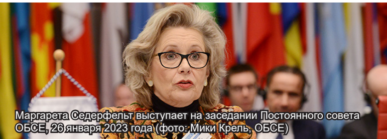
Маргарета Седерфельт выступает на заседании Постоянного совета ОБСЕ, 26 января 2023 года

26 января Председатель Парламентской ассамблеи ОБСЕ Маргарета Седерфельт выступила на заседании Постоянного совета ОБСЕ, где заявила, что война Российской Федерации против Украины представляет собой самую серьезную угрозу основополагающим принципам ОБСЕ. Она отметила, что ПА будет и впредь оказывать коллективное давление с целью привлечения к ответственности за зверства, совершаемые в Украине, с сожалением добавив, что дипломатия не привела к окончанию войны. Она подчеркнула, что ПА решительно выступает в поддержку восстановления мира в соответствии с нормами международного