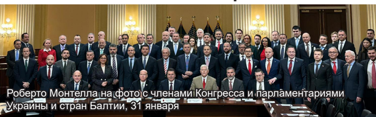
Роберто Монтелла на фото с членами Конгресса и парламентариями Украины и стран Балтии, 31 января

На этой неделе Генеральный секретарь ПА ОБСЕ Роберто Монтелла находится в Вашингтоне, где проводит встречи с членами делегации США в ПА ОБСЕ и Хельсинкской комиссии в рамках подготовки к зимнему заседанию в конце февраля. В частности, он встретился с главой делегации Беном Кардином, занимающим пост Специального представителя ПА ОБСЕ по проблемам антисемитизма, расизма и нетерпимости, заместителем Председателя ПА ОБСЕ Роджером Уикером, Стивеном Козном, заместителем главы делегации и Специальным представителем по политическим заключенным, Робертом Адерхольтом, бывшим заместителем Председателя ПА, и Джо Уилсоном, высокопоставленным членом Хельсинкской комиссии.