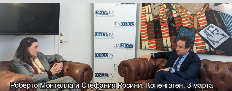
Роберто Монтелла и Стефания Росини, Копенгаген, 3 марта

3 марта в Копенгагене состоялась встреча Генерального секретаря Роберто Монтеллы с Послом Италии в Дании Стефанией Росини. Обсуждалось важное значение ОБСЕ для европейской архитектуры безопасности, в особенности в контексте войны Российской Федерации против Украины.