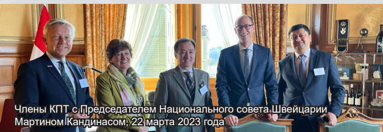
Члены КПП с Председателем Национального совета Швейцарии Мартином Кандинасом, 22 марта 2023 года

В рамках визита членов Специального комитета ПА ОБСЕ по противодействию терроризму (КПП) на этой неделе состоялись встречи с широким кругом представителей международного сообщества и правительства Швейцарии, в ходе которых обсуждались международные тенденции в области терроризма и стратегии по предупреждению радикализации в местных общинах. Визит начался во вторник в Женеве и завершился серией встреч в Берне в среду.