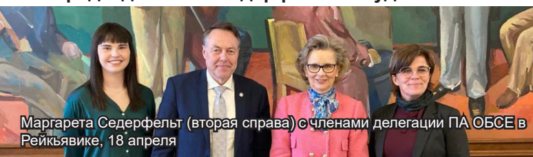
Маргарета Седерфельт (вторая справа) с членами делегации ПА ОБСЕ в Рейкьявике, 18 апреля

Председатель ПА ОБСЕ Маргарета Седерфельт (Швеция) находилась на этой неделе с визитом в Исландии, в рамках которого она во вторник обсудила актуальные вызовы в регионе ОБСЕ с представителями парламента и правительства. Война Российской Федерации против Украины стала основной темой состоявшихся переговоров, в ходе которых Председатель М.Седерфельт и ее собеседники отметили угрозы, которым подвергается международная система в результате нарушения ключевых международных обязательств, включая Устав ООН и Хельсинкский заключительный акт. В ходе встреч со Спикером Алтинга Биргиром Арманссоном и Министром иностранных дел Тордис Кольбрун Рейкфьорд Гольфадоттир Председатель М.Седерфельт приветствовала активное участие делегации Исландии в ПА ОБСЕ, в частности деятельность Бриндис