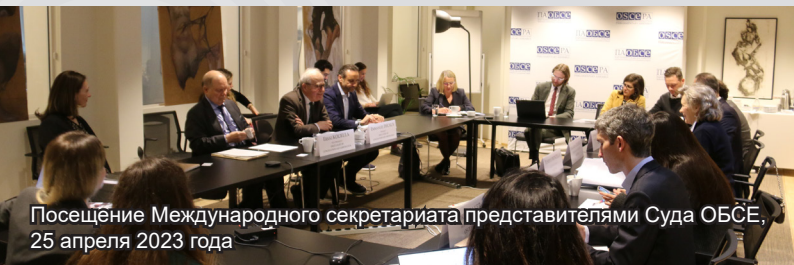
Посещение Международного секретариата представителями Суда ОБСЕ, 25 апреля 2023 года