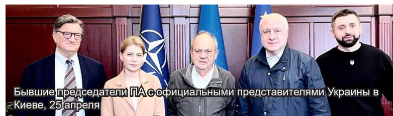
Бывшие председатели ПА с официальными представителями Украины в Киеве, 25 апреля

У делегации состоялись встречи с первым заместителем Спикера Александром Корниенко, лидером парламентского большинства Давидом Арахамией, заместителем Премьер-