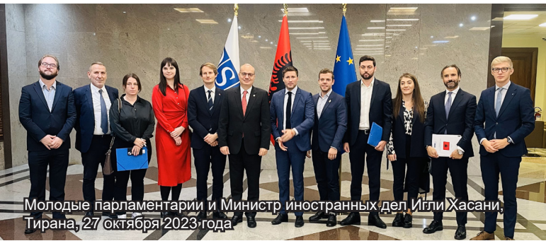
Молодые парламентарии и Министр иностранных дел Игли Хасани, Тирана, 27 октября 2023 года