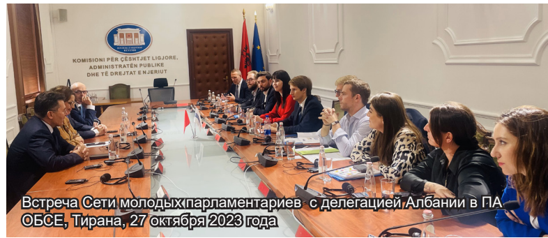
Встреча Сети молодых парламентариев с делегацией Албании в ПА ОБСЕ, Тирана, 27 октября 2023 года

28 октября члены Сети молодых парламентариев ПА ОБСЕ завершили свой двухдневный визит в Албанию, в ходе которого встретились с парламентариями, представителями государственных структур, организаций гражданского общества, возглавляемых молодежью, и студентами. В ходе визита, организованного делегацией Албании в ПА ОБСЕ, обсуждался широкий спектр вопросов, включая участие молодых людей в политике, перспективы вступления Албании в ЕС, новые вызовы в сфере безопасности и роль ОБСЕ в регионе.