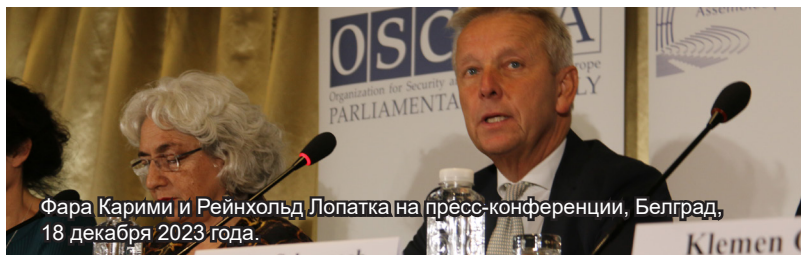
Фара Карими и Рейнхольд Лопатка на пресс-конференции, Белград, 18 декабря 2023 года.

Совместная наблюдательная миссия ПА ОБСЕ, БДИПЧ ОБСЕ, ПАСЕ и Европейского парламента заключила, что на внеочередных парламентских выборах в Сербии 17 декабря избирателям была предоставлена возможность выбора между политическими альтернативами, но при этом на них оказывалось давление. Кроме того, избирательный процесс в целом дискредитировали решающее участие Президента и наличие системных преимуществ у правящей партии. По мнению наблюдателей, законодательство обеспечивает необходимые стандарты для проведения демократических выборов, однако в его рамках неурегулированным остается большое число вопросов, включая отсутствие разделения между официальными функциями и деятельностью, связанной с избирательной кампанией. Наблюдатели также выявили случаи запугивания и подкупа избирателей.