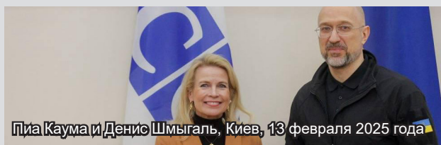
Пиа Каума и Денис Шмыгаль, Киев, 13 февраля 2025 года