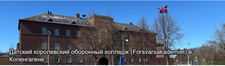
Датский королевский оборонный колледж (Forsvarsakademiet) в Копенгагене.

Достопочтенный Марк Притчард (Великобритания), который является Специальным представителем ПА ОБСЕ по Арктике и Крайнему Северу, на прошлой неделе встретился в Копенгагене с рядом экспертов для обсуждения вопросов безопасности и экологических вызовов в регионе. 28 апреля специальный представитель Притчард провёл переговоры с руководством и исследователями Датского королевского оборонного колледжа и Датского института международных исследований. Визит создал условия для диалога на высоком уровне с ключевыми партнёрами и конструктивного обмена мнениями по вопросам развития Арктики, включая обсуждение арктических приоритетов в более широком политическом контексте, с особым вниманием к роли