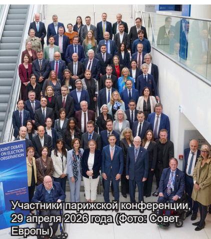
Участники парижской конференции, 29 апреля 2026 года