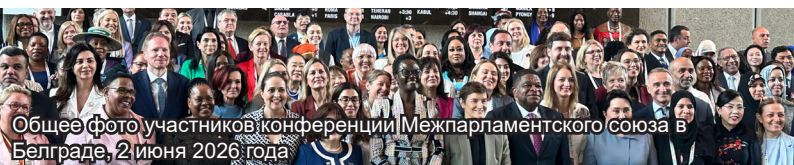
Общее фото участников конференции Межпарламентского союза в Белграде, 2 июня 2026 года