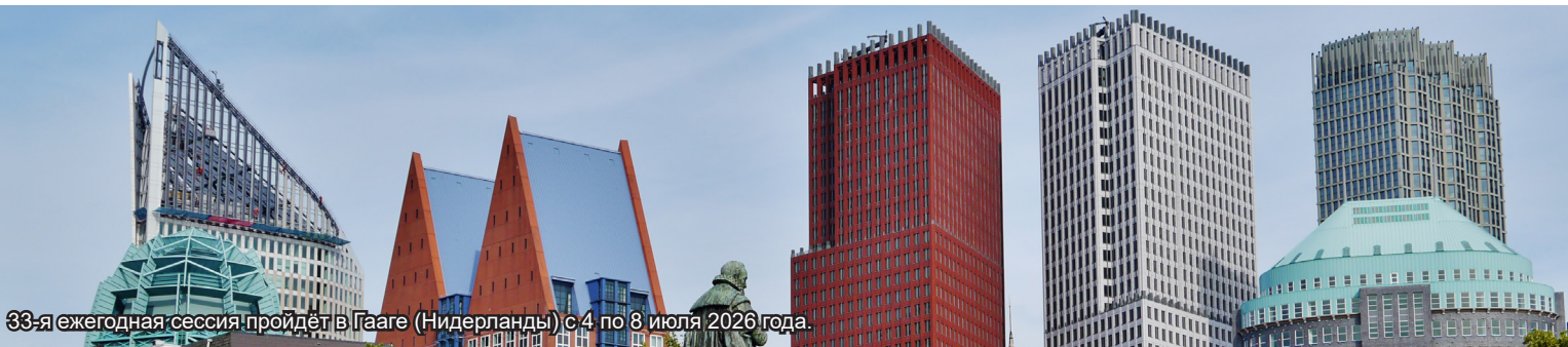
33-я ежегодная сессия пройдёт в Гааге (Нидерланды) с 4 по 8 июля 2026 года.

Премьер-министр Нидерландов Роб Йеттен и Министр иностранных дел Том Берендсен выступят на 33-й ежегодной сессии ПА ОБСЕ в Гааге. Их выступления перед Ассамблеей запланированы соответственно на 4 и 6 июля. Премьер-министр Йеттен и Министр иностранных дел Берендсен присоединятся к другим высокопоставленным должностным лицам, которые выступают перед более чем 250 парламентариями из 54 государств региона ОБСЕ.