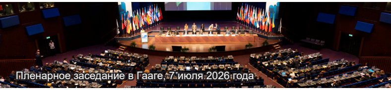
Пленарное заседание в Гааге, 7 июля 2026 года