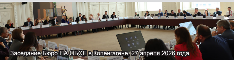
Заседание Бюро ПА ОБСЕ в Копенгагене, 27 апреля 2026 года