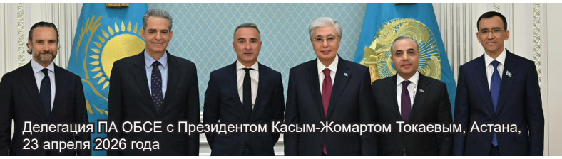
Делегация ПА ОБСЕ с Президентом Касым-Жомартом Токаевым, Астана, 23 апреля 2026 года