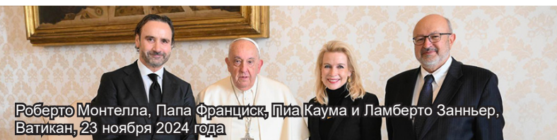
Роберто Монтелла, Папа Франциск, Пиа Каума и Ламберто Занньер, Ватикан, 23 ноября 2024 года

23 ноября Председатель Парламентской ассамблеи ОБСЕ Пиа Каума (Финляндия), находившаяся в сопровождении Генерального секретаря Роберто Монтеллы и Посла Ламберто Занньера, встретила с Его Святейшеством Папой Франциском в Ватикане. На встрече обсуждалась важная роль парламентской дипломатии