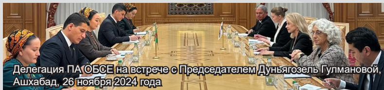
Делегация ПА ОБСЕ на встрече с Председателем Дуньягозель Гулмановой, Ашхабад, 26 ноября 2024 года

В ходе встреч с Председателем Парламента Туркменистана Дуньягозель Гулмановой и Министром иностранных дел Рашидом Мередовым обсуждалась роль парламентской дипломатии и была акцентирована важность долгосрочного плодотворного сотрудничества между Туркменистаном и ОБСЕ.