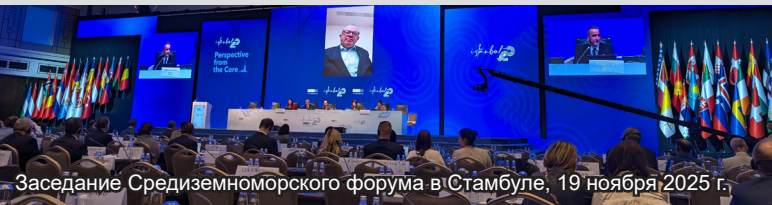
Заседание Средиземноморского форума в Стамбуле, 19 ноября 2025 г.