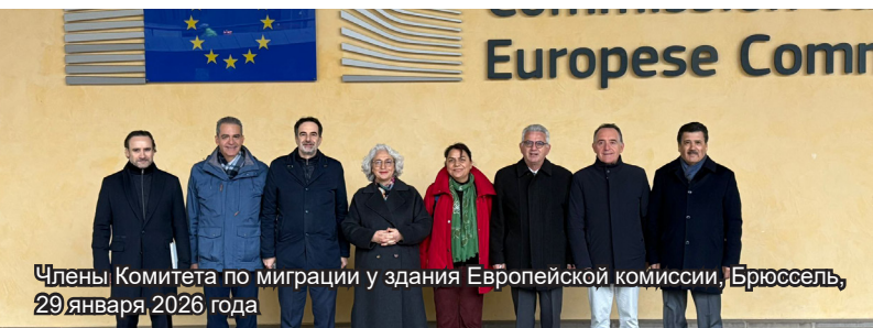
Члены Комитета по миграции у здания Европейской комиссии, Брюссель, 29 января 2026 года

Делегация из семи членов Специального комитета Парламентской Ассамблеи ОБСЕ по миграции во главе с Председателем Фарой Карими (Нидерланды) при участии Генерального секретаря Роберто Монтеллы на прошлой неделе находилась в Брюсселе, чтобы подробнее ознакомиться с последними изменениями в процессе реформирования европейской миграционной политики, уделив особое внимание реализации Пакта ЕС по миграции и убежищу и ожидаемым последствиям его внедрения.