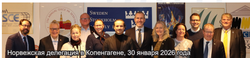
Норвежская делегация в Копенгагене, 30 января 2026 года