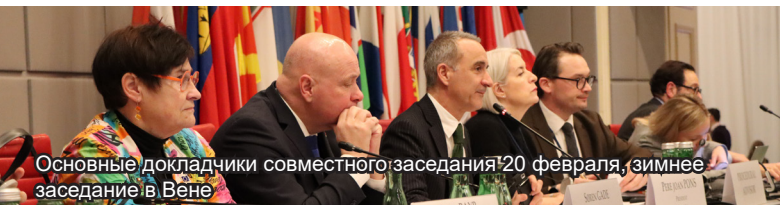
Основные докладчики совместного заседания 20 февраля, зимнее заседание в Вене

Парламентская ассамблея ОБСЕ провела своё 25-е зимнее заседание в Вене 19–20 февраля. Открытие заседания было посвящено ситуации в Украине: высокопоставленные выступающие — включая Председателя Национального совета Австрии Вальтера Розенкранца, Председателя Верховной Рады Украины Руслана Стефанчука, Председателя ПА ОБСЕ Пере Хуана Понса (Испания) и Генерального секретаря ОБСЕ Феридуна Синирлиоглу — осудили войну и подчеркнули её разрушительные последствия для гражданского населения Украины и основополагающих принципов международного права. Также вновь прозвучали призывы к освобождению трёх незаконно удерживаемых сотрудников ОБСЕ: Вадима Голды, Максима Петрова и Дмитрия Шабанова.